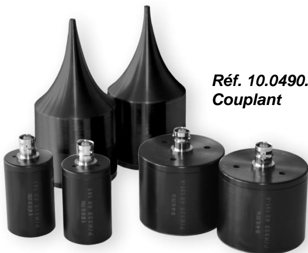
Réf. 10.0490.701 Couplant